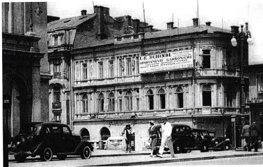
Imobilul Mandy, pregătit pentru demolare

După un timp, un întreprinzător a reînființat Gambrinusul pe Bd. Regina Elisabeta, la colțul cu Brezoianu. Localul funcționează și acum acolo.