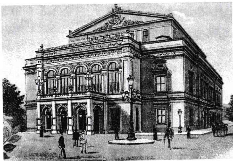
Vechiul Teatru Național văzut din fața Hotelului Continental (cca 1890)