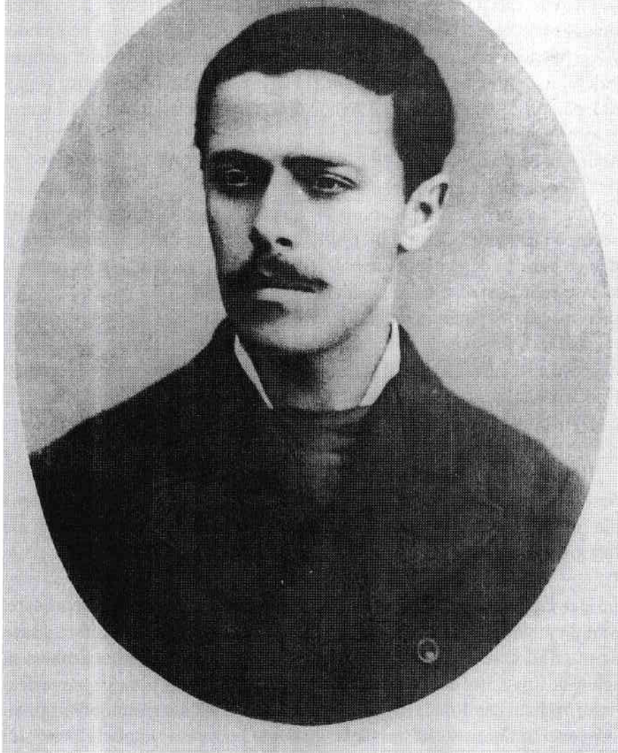
Caragiale la 25 de ani